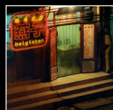
Alexandre Titre composé pour le troisième album de Néry "Néry Belgistan" © 2006 Odeon / EMI