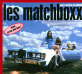
Une Carrière en Plomb LP 12 titres © 1999 Next Music