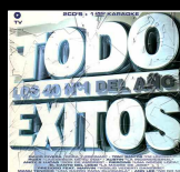
Y Alejandra Baila Titre chanté en espagnol pour la compilation "Todo Exitos vol. 7" sous le pseudonyme de Serge Le Cowboy © 2003 Vale Music Spain