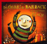
Quand Vient le Petit Matin Participation à l'album "La Pittoresque Histoire de Pitt Ocha" des Ogres de Barback © 2003 Irfan