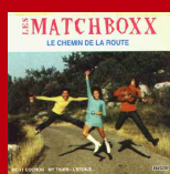
Le Chemin de la Route Maxi 8 titres © 1997 Autoproduction